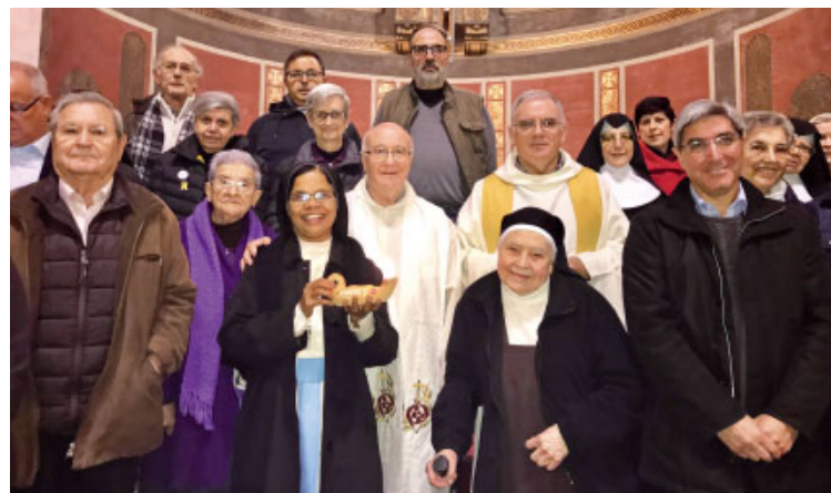
Religiosos i religioses presents a la celebració de l'1 de febrer

El dia de la Presentació del Senyor, la popular «Candelera» del dia 2 de febrer, se celebra la Jornada Mundial de la Vida Consagrada i també els patrons del moviment cristià de gent gran Vida Creixent. A la nostra diòcesi, enguany, es va celebrar conjuntament amb l'eucaristia del dia de vigília, dissabte 1 de fe-