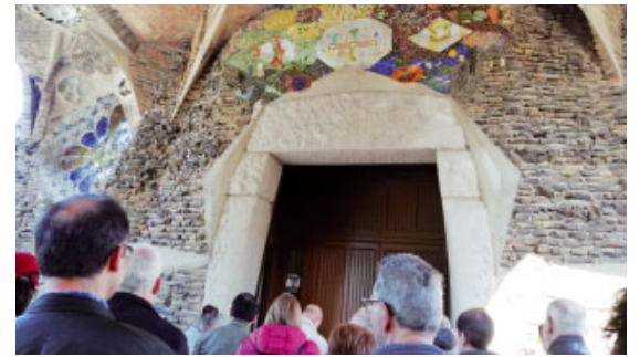
Durant la visita a la cripta de la Colònia Güell

Durant la setmana es van realitzar diverses sessions de lectio divina , de meditació i reflexió amb salms, evangelis, cartes del Nou Testament, etc., a Esplugues de Llobregat, Pallejà, Sant Boi de Llobregat i Vilafranca del Penedès. Aquests actes van tenir una bona resposta per part de les persones participants, perquè ajuden a prendre consciència que la Paraula de Déu, present a la Bíblia, ens guia i il·lumina el camí a seguir per arribar a l'encontre amb el Pare. També els moments de silenci, pregària, meditació i compartició, ens uneixen i enforteixen per poder continuar endavant en la vida quotidiana.